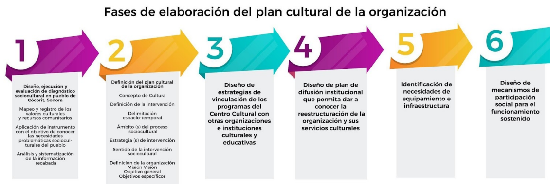
Gráfico 1. Fases de elaboración del plan cultural de la organización

Fuente: Elaboración: Mariscal, J. y Aguilar, A. (2019)