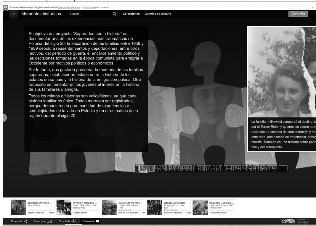
Imagen 3. Vista general del sitio web Momentos Históricos - Google. Colección: Separados por la historia .