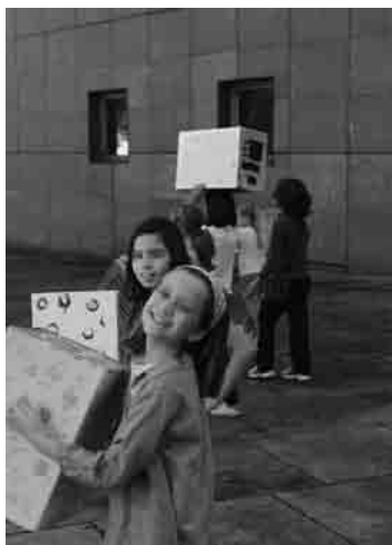
Figura 8 - Conjunto de piezas finalizadas.