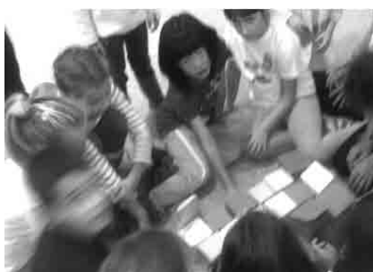
Figura 1 · El proyecto, desarrollado con un grupo de niño/as de entre seis y doce años, se realizó en tres sesiones y en dos fases de actuación.