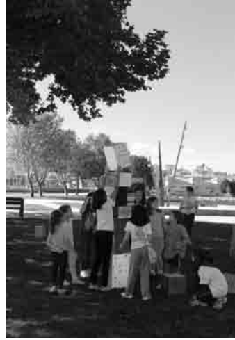
Figura 11 · Con los visitantes de la Isla de las Esculturas.