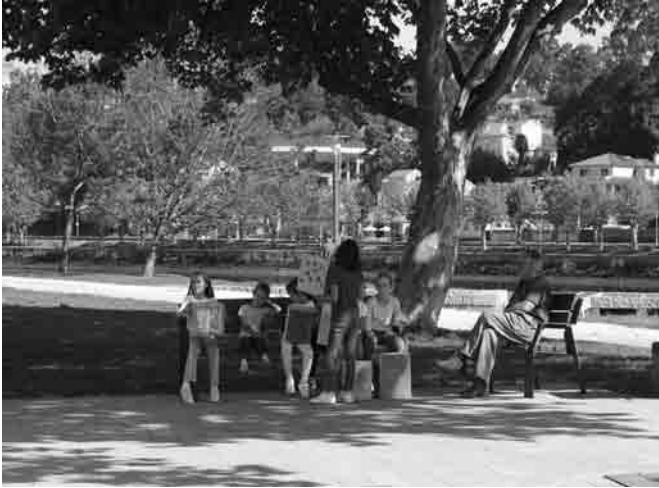
Figura 10 · Diversos momentos de la intervención final.