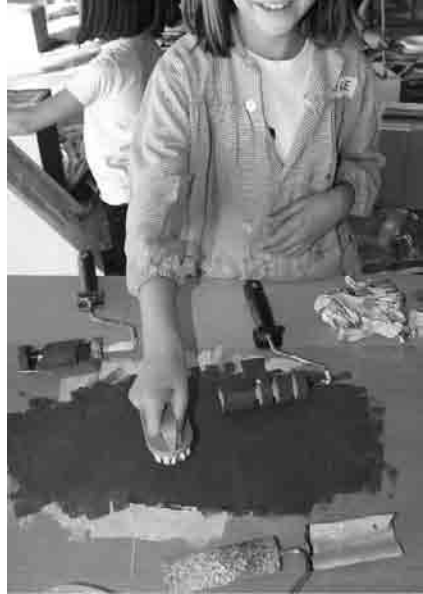
Figura 5 · En proceso: experimentado con plantillas, reservas y estampando.