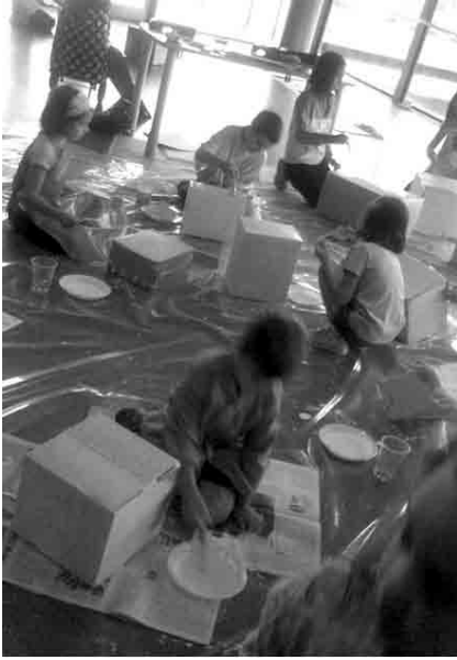
Figura 4 · En el taller construyendo e imprimado las piezas y piezas construidas, en proceso secado.