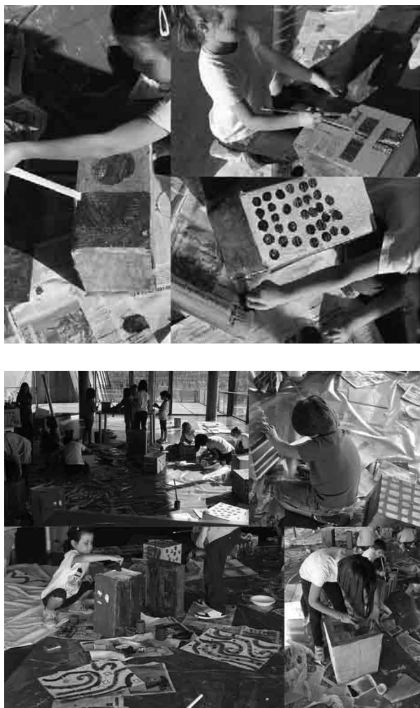
Figura 6 · En proceso: experimentado con plantillas, reservas y estampando.