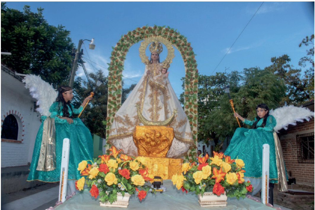
Figura 4: La representación de Nuestra Señora del Rosario de Tintoque, Valle de Banderas, Nayarit [Fotografía].

El turismo de sol y playa emplazado en esta región se concentra en pocas localidades consideradas con toda propiedad destinos turísticos, las dos festividades que seleccionamos no constituyen propiamente turismo religioso porque proponen la exposición de un bien cultural intangible mezclado con otros atractivos de índole no religiosa volcados abiertamente a la explotación como atractivo turístico. En ese sentido, las fiestas patronales empiezan a considerarse como otra alternativa de negocio, en la modalidad de turismo cultural con un ideario que propone comprender la otredad, convivir con el otro independientemente de la fe profesada, como un performance o representación que deviene en espectáculo público.