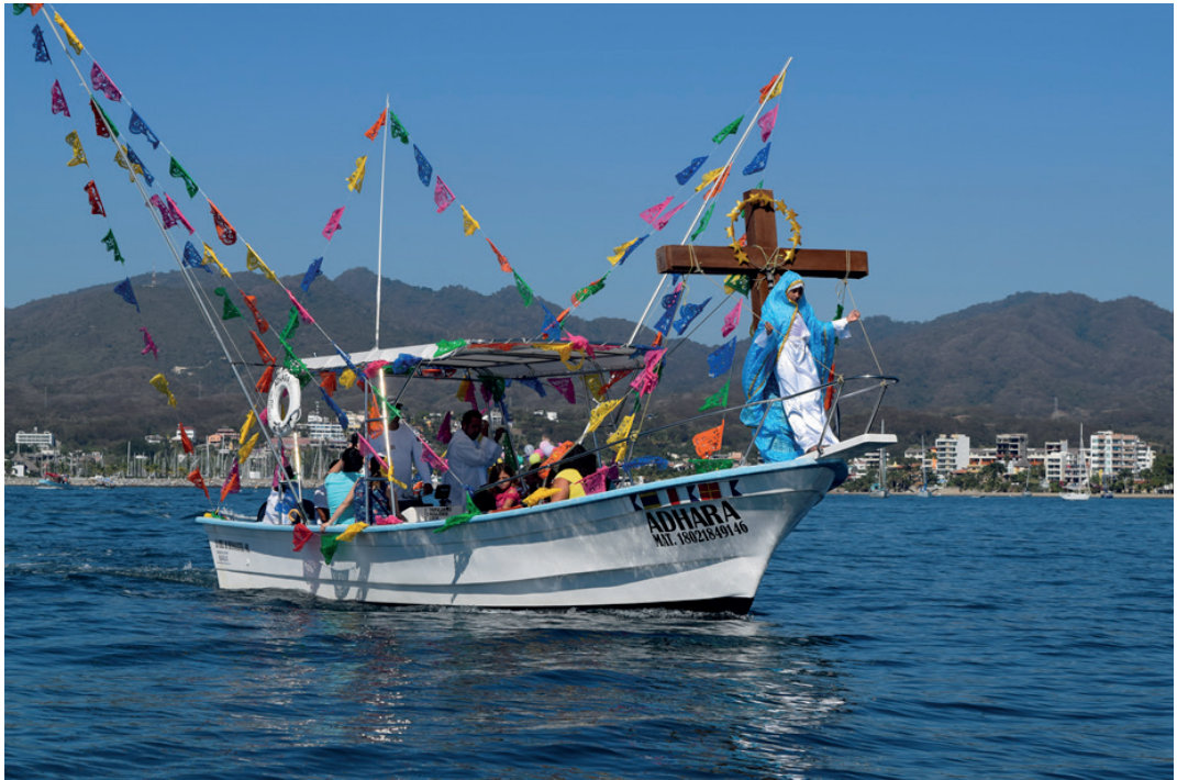
Figura 2: Procesión marítima de la festividad de Nuestra Señora de la Paz, Bucerías, Nayarit [Fotografía]. Recuperado durante el trabajo de campo de la investigación.