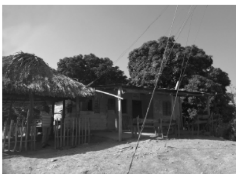
FIGURA 7. Kiosco Vive Digital del corregimiento de Piñique (Clemencia)

Con base en los principales resultados obtenidos de la aplicación de encuestas a los gestores de los KVD, tenemos que existen varias similitudes con respecto a los cibercafés, pero también algunas diferencias. Por un lado, las tarifas en los KVD son inferiores a las de los cibercafés al estar subsidiadas por el gobierno nacional, y oscilan entre los 200 y 800 pesos por hora. Estos Kioscos prestan su servicio principalmente en sedes educativas, brindando conectividad a la comunidad escolarizada en la jornada escolar y en contrajornada atienden a la comunidad en general durante la semana, en diferentes horarios. Sin embargo, también funcionan de manera especial en algunas residencias de los habitantes de las localidades, como se evidencia en las figuras 6 y 7.