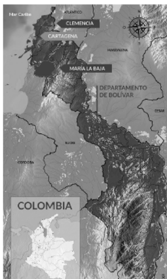
FIGURA 1. Localización geográfica de los municipios de Clemencia y María la Baja

Los municipios de Clemencia y María la Baja están situados al norte del departamento de Bolívar, en la región Caribe colombiana (figura 1). Clemencia, municipio de unos 12.540 habitantes tiene una extensión de alrededor de 84 km 2 , de los cuales casi tres cuartas partes son área urbana. El municipio es atravesado por la vía principal que comunica Cartagena con Barranquilla y a nivel poblacional, ha vivido desde finales de los noventa un proceso de migración del campo hacia la cabecera municipal. En el 2015 el 78 % de la población vivía en zona urbana (Paulhiac et al., 2016). A nivel educativo, en el 2013 la cobertura bruta en Clemencia fue de 109 % (porcentaje de la totalidad de estudiantes matriculados en el sistema educativo) y la cobertura neta es de 87 % (porcentaje de estudiantes matriculados en el sistema educativo; sin contar los que están en extraedad –por encima de la edad correspondiente para cada grado–) (Paulhiac et al., 2016). En cuanto a María la Baja, municipio de unos 547 km 2 , esta localidad cuenta con unos 48.079 habitantes (DANE, 2005). A diferencia de Clemencia, casi tres cuartos del territorio de María la Baja está ubicado en zona rural y el municipio está lejos de otras capitales departamentales. La población de María la Baja ha sido históricamente rural, en el 2005 con un 60 % de la población viviendo fuera de la cabecera municipal. A nivel educativo, en el 2013 la cobertura bruta en María la Baja fue de 110 % y su cobertura neta del 90 %.