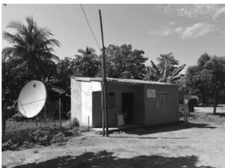
FIGURA 6. Kiosco Vive Digital del corregimiento de Montecristo (María la Baja)