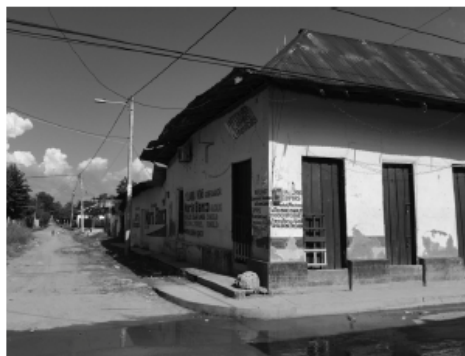
FIGURA 5. Cibercafé Divina Stereo. María la Baja Fuente. Elaboración propia, 2016

Los administradores de estos sitios reportan que entre los servicios más vendidos están las fotocopias, escáner e impresiones. También es frecuente el servicio de llamadas telefónicas, el cual es “utilizado para atraer clientes” y generar ganancias adicionales. Entre otro tipo de servicios que brindan estos establecimientos, prevalece los trabajos de transcripciones o trabajos en computador, como producto de las tareas y actividades escolares que acuden a realizar los estudiantes.