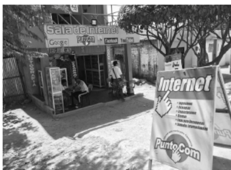
FIGURA 4. Cibercafé Puntocom. Clemencia

Durante las visitas a estos municipios se evidenció una mejor organización en los cibercafés ubicados en el municipio de Clemencia (figura 4), los cuales tienen un mayor tiempo de funcionamiento con respecto a María la Baja. En Clemencia los primeros cibercafés empezaron a funcionar en el 2009, mientras que en María la Baja estos espacios aparecen desde el 2012. En Clemencia se destaca una mayor comodidad y privacidad para los usuarios con cubículos individuales en paneles, buena conectividad y equipos actualizados, así como presencia de equipos periféricos como cámara, audífonos y diferentes programas (software). Estas comodidades tienden a ser más escasas en los cibercafés de María la Baja, cuyo carácter parece más rústico (figuras 4 y 5).