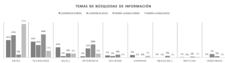
FIGURA 9. Volúmenes de búsquedas en motores por municipio y tipo de espacio tecnológico

Otro aspecto por resaltar es la búsqueda de información a través de portales como Google. Estos son una herramienta fundamental para la clasificación y recuperación de informaciones en la web. De las 11.906 páginas registradas, 839 correspondieron a resultados de búsquedas en los motores de Google.com (67 %) y Youtube.com (33 %). No se detectaron búsquedas en otros motores. De estas 839 búsquedas, aproximadamente 564 fueron búsquedas únicas por usuario o sesión (esta cifra es aproximada, ya que no se contó con un identificador específico de usuario). El análisis de las palabras clave y de las frases ingresadas permitió la clasificación de las búsquedas en temas y subtemas. La clasificación se hizo tomando en cuenta el sentido principal de la frase de búsqueda y no de cada palabra individual. La tabla 2 resume estos hallazgos en porcentaje de búsquedas por tema, para cada tipo de espacio y por municipio.