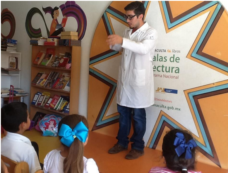
Fotografía 1. Taller “En busca del Príncipe y la Princesa del medio ambiente”. Kinder Xamayan Jamay, Jalisco