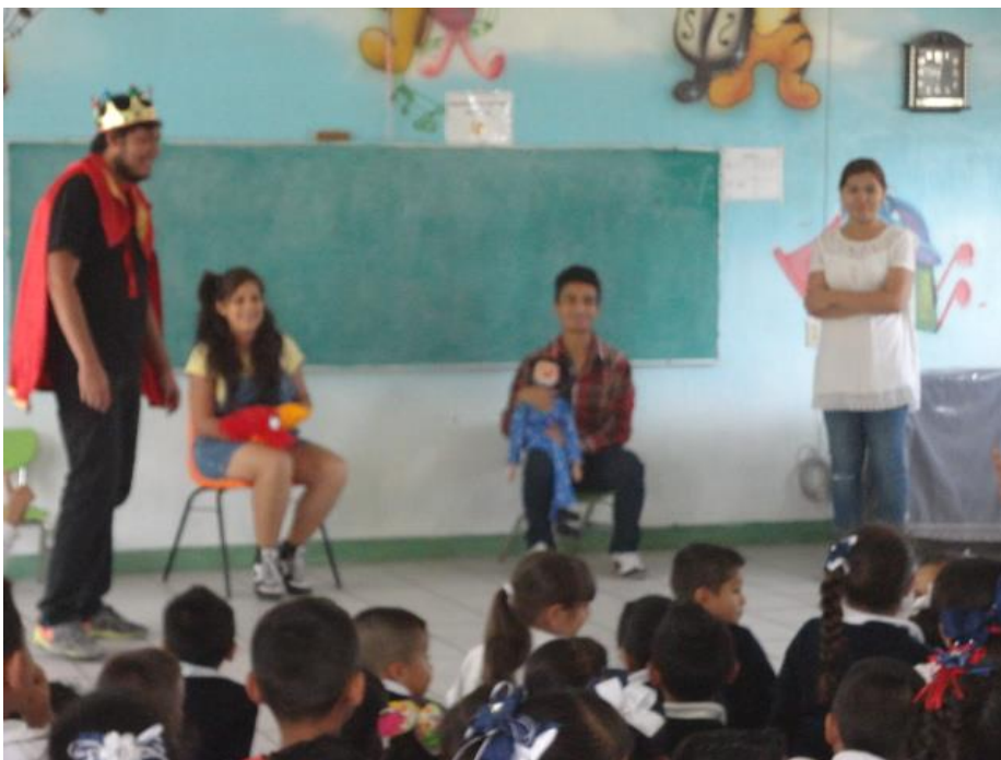
Fotografía 1. Taller en la Escuela Primaria Valentín Gómez Farías, Ocotlán Jalisco