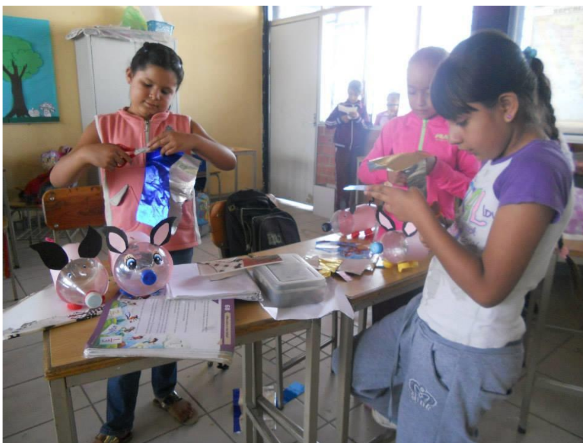
Fotografía 1. Taller en la escuela primaria Federal José López Portillo y Rojas

Las actividades de vinculación se realizaron a partir de una serie de talleres, charlas, etc. relacionadas con el 5 de junio Día Mundial del Medio Ambiente en escuelas de los municipios de Ocotlán y Jamay. Participaron un total de 63 estudiantes de las carreras de Periodismo y Psicología de los semestres segundo y tercero. Se llevaron a cabo 15 presentaciones en escuela de educación preescolar y primaria. Participaron un total aproximado de 382 entre 3 y 12 años.