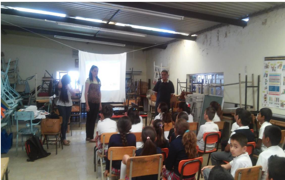
Fotografía 1. Taller en la Sala de Lectura de Ocotlán