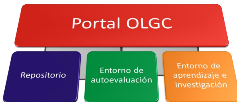
Gráfico 3. Entornos virtuales del OLCG

Como se puede observar, el repositorio se plantea como un entorno virtual interconectado a otras plataformas, conformando así un sistema integrado de gestión de la información y el conocimiento especializado en gestión cultural. 14 Así, el objetivo del repositorio es reunir, organizar y socializar recursos informativos relacionados con el campo de la gestión cultural con el propósito de fortalecer los procesos de formación, investigación y práctica de los gestores culturales en Latinoamérica.