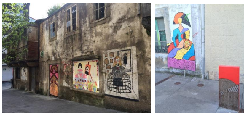
Figs. 4-5. Murales y mobiliario urbano inspirados en “Las Meninas”

Hasta la fecha se han llevado a cabo un total de siete ediciones, ya que en los años 2011 y 2012 no se pudieron celebrar por diferentes motivos. Cada año el número de pintores/as y artistas que acuden a la cita va en aumento, así como los/as vecinos/as que ceden sus fachadas para la elaboración de nuevos murales. Cabe destacar que “Las Meninas” no se limitan únicamente a la pintura, sino que engloban otras actividades artísticas. Por ejemplo, durante los días en que se celebran se realizan actividades de todo tipo: talleres para la infancia y para adultos, conciertos, representaciones teatrales, proyecciones audiovisuales, etc.