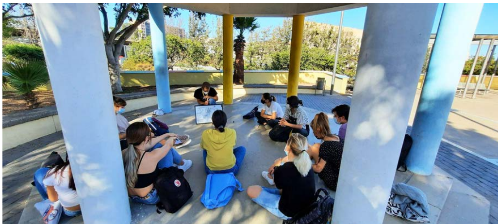
Figura 3. Barrio de Las Moraditas como aula abierta universitaria.

Actualmente, la iniciativa es enteramente promovida por alumnado y profesorado de la Facultad de Bellas Artes de la Universidad de La Laguna, conjuntamente con vecinas, vecinos y amigos del barrio, aunque es un proceso abierto al que todas las personas están invitadas a sumarse. Cada año, durante el curso académico, visitamos a la comunidad en numerosas ocasiones con el alumnado de diferentes asignaturas, para relacionar lo que aprenden en el aula con la realidad de la calle, proponiendo acciones al servicio de la comunidad (véase Figura 3). Apostamos por la vinculación de la academia al territorio como modelo de retroalimentación y aprendizaje, siguiendo la metodología del Aprendizaje-Servicio (ApS) como medio para promover la participación activa de los estudiantes en experiencias participativas que se integran en el currículum académico.