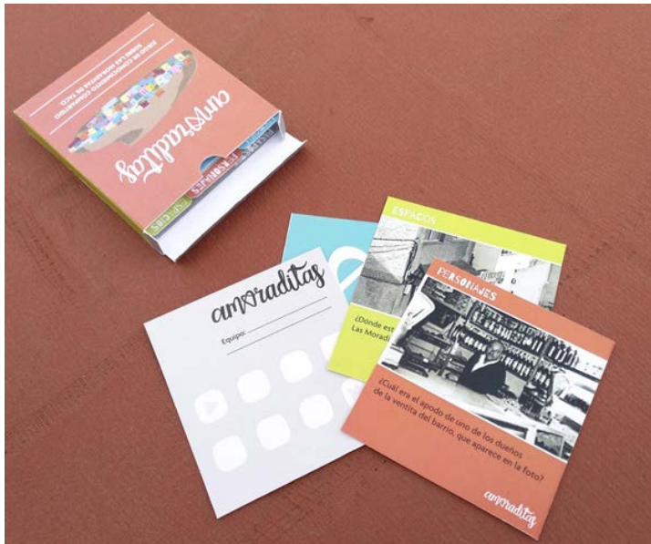
Figura 5. Juego de conocimiento compartido de la memoria colectiva del barrio.