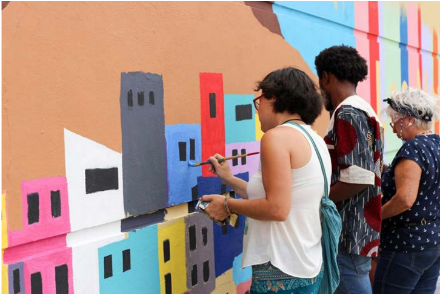
Figura 4. Realización de mural comunitario en La Plaza en el contexto del Encuentro Amoraditas 2018.