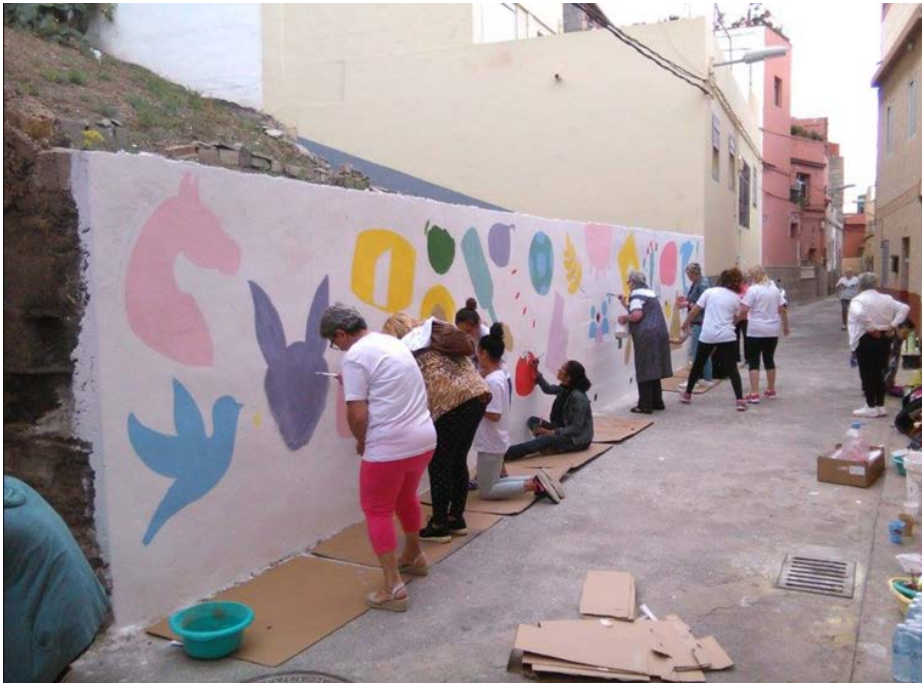
Figura 7. Mural comunitario realizado en el marco de una de las actividades más relevantes del ICI-Taco: el CONvive-Taco .