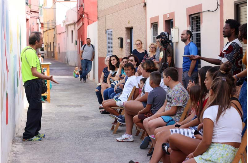
Figura 6. Vecino de Las Moraditas compartiendo con los jóvenes juegos tradicionales e historias populares.