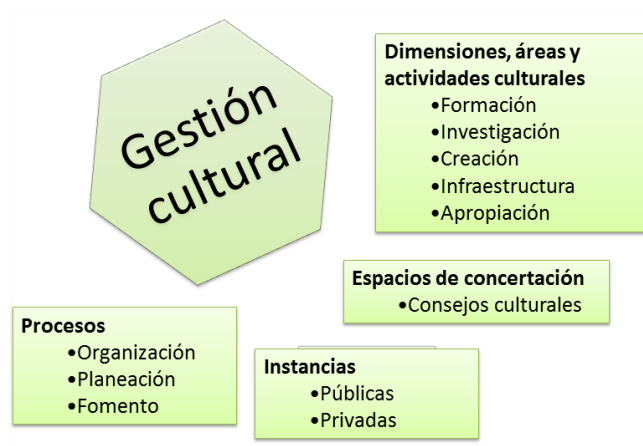
Figura 1. Aspectos de configuración de la gestión cultural. Adaptado de (ALCALDÍA DE BOGOTÁ, 2004)

Ahora se pasará a describir cada una de las subdivisiones a las que se encuentra sujeta la gestión del campo cultural y artístico, a partir de lo expuesto en las políticas culturales territoriales de la ciudad de Bogotá (ALCALDÍA DE BOGOTÁ, 2004):