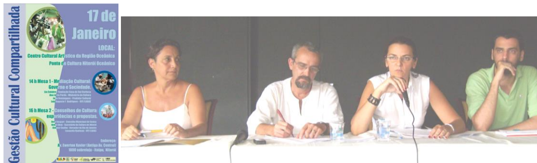
Seminário Gestão cultural compartilhada