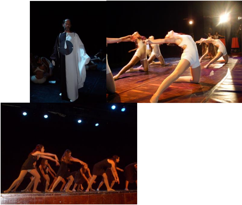
ESPETÁCULO TEMPO (Teatro da UFF, novembro de 2009)