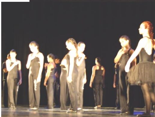
ESPETÁCULO QUEM NÃO DANÇA... DANÇA (Teatro Popular de Niterói (novembro de 2008)